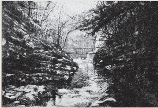
1 re passerelle des Clées 📷2