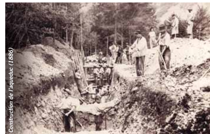
Construction de l'aqueduc (1886)