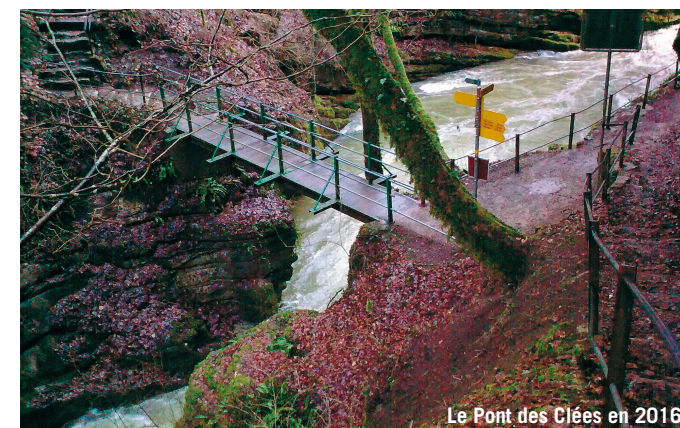
Le Pont des Clées en 2016