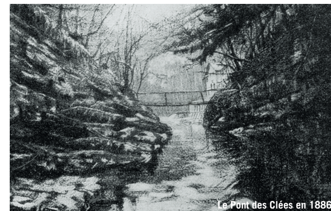
Le Pont des Clées en 1886